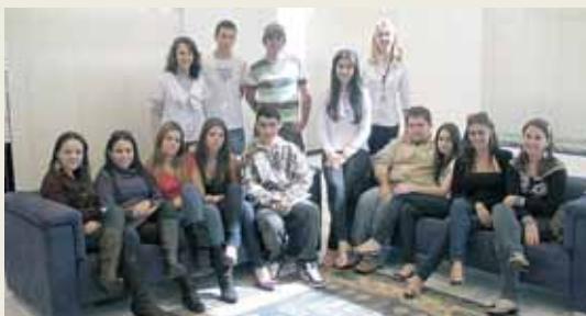
IFES - Itajaí