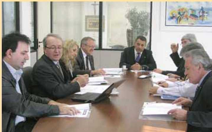
Primeira reunião foi realizada em maio

No último encontro ficou definida uma nova edição do folder da Feconac que traz a relação de todas as obrigações acessórias que o contabilista é obrigado a prestar ao Fisco. Esta é uma forma de conscientizar os empresários do volume de trabalho e da responsabilidade que pesa