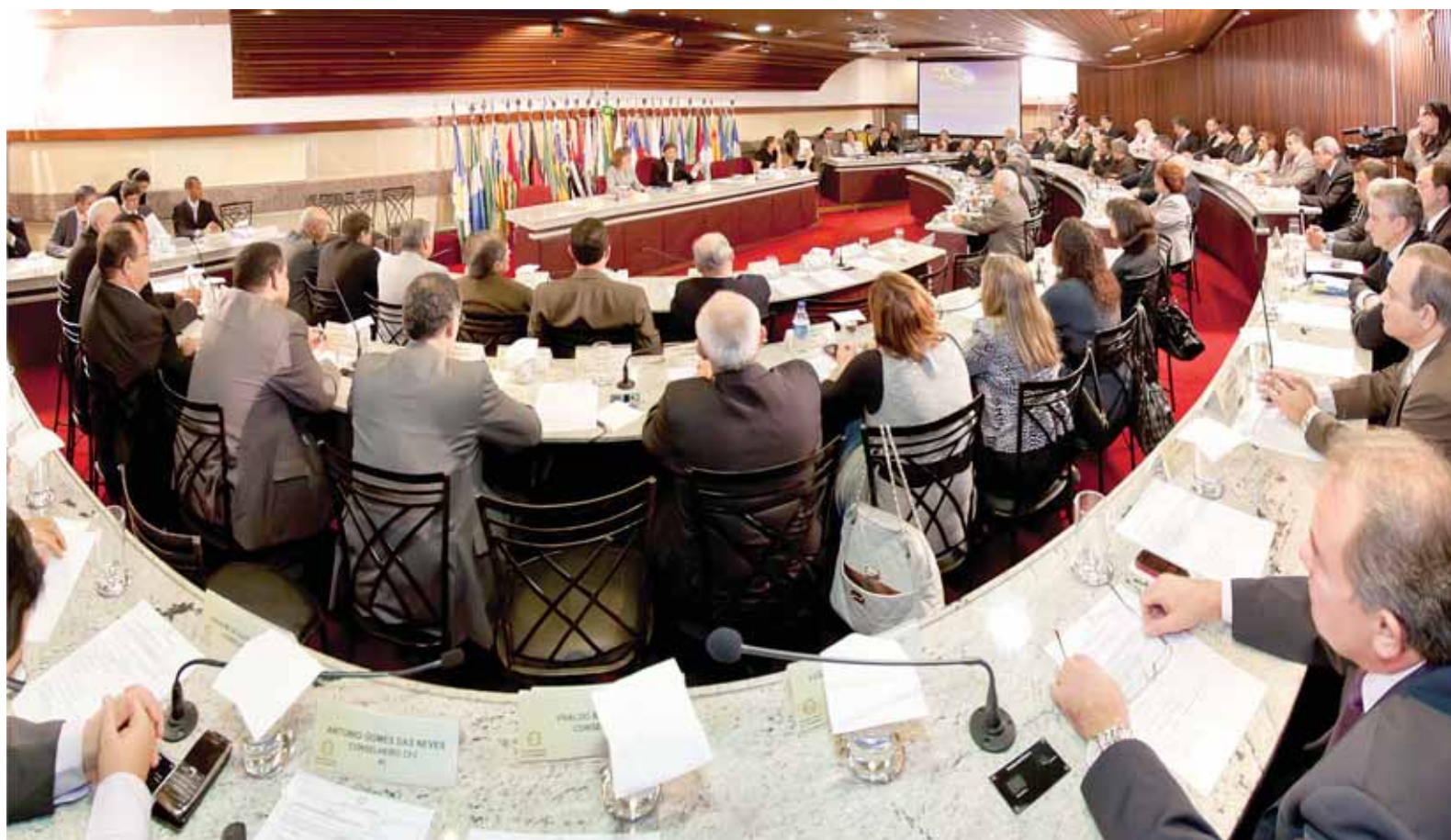
Reunião no CFC com todos os Conselhos Regionais de Contabilidade, dia 18, em Brasília, debateu a nova legislação e comemorou esta importante vitória