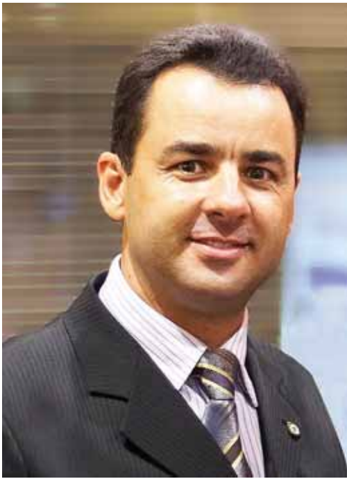
FALE COM O PRESIDENTE (48) 9974-0009 | faraco@faracon.com.br.

Preocupadas com as notas que seus alunos apresentariam no Exame, as instituições de ensino adotaram várias medidas para melhorar a qualidade do