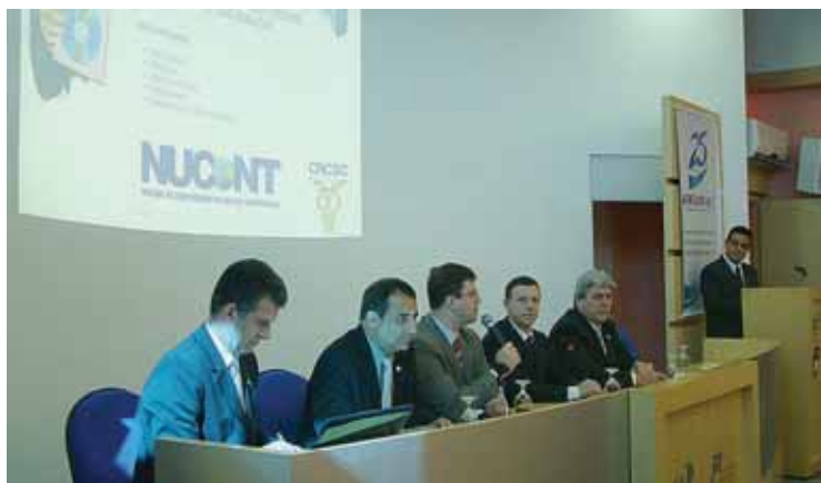
Um dos vários eventos promovidos pelo Nucont

Depois de dois anos instalados, na sede do CRCSC, o núcleo recebeu a proposta de se aliar à AEMFLO/CDL de São José, que ofereceu - além das instalações - a infraestrutura de secretaria e o acompanhamento de um consultor capacitado na metodologia do Programa Empreender. Nesse período, muitas atividades foram realizadas: palestras, curso de oratória para contadores e eventos de cunho social, como arrecadação de alimentos para entidades assistenciais e orientação à população sobre o correto preenchimento da declaração do imposto de renda.