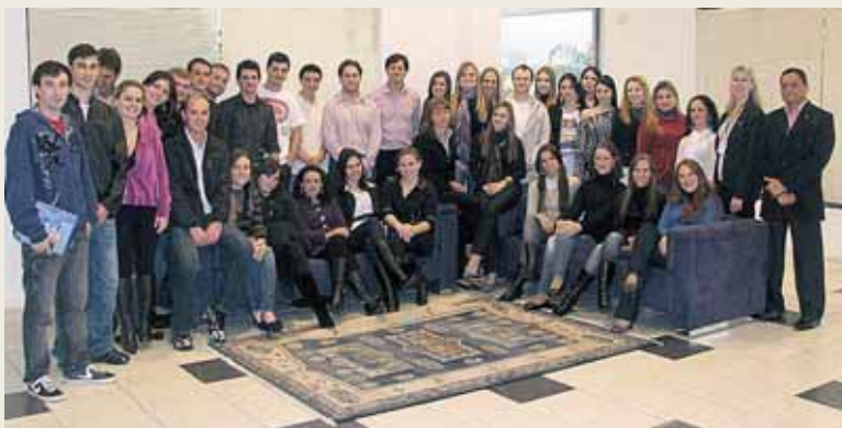
Unidavi - Rio do Sul