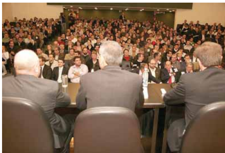
Audiência sobre Substituição Tributária, realizada em 13 de junho, lotou o auditório do Legislativo catarinense