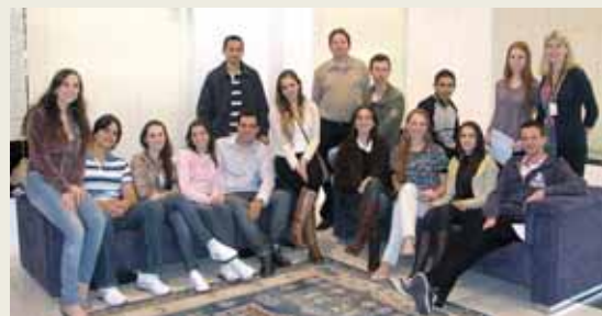
UNIFEBE - Brusque