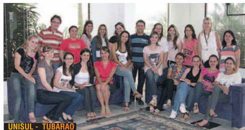
UNISUL - TUBARÃO