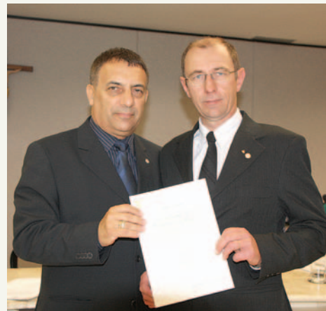
Novo delegado de Mafra recebe o termo de posse

Para o presidente do CRCSC, os dois profissionais irão contribuir muito para o fortalecimento e a valorização da classe contábil em suas regiões.