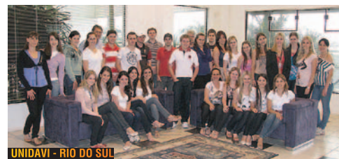
UNIDAVI - RIO DO SUL