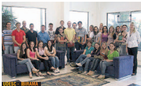
UDESC - IBIRAMA