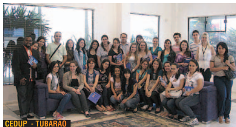
CEDUP - TUBARÃO