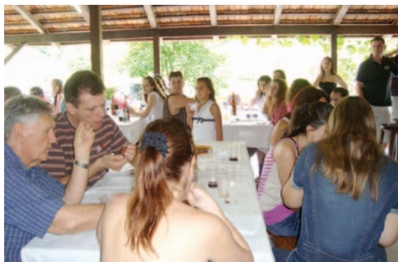
Jaraguá do Sul

A Contabilidade Up Time foi a empresa que obteve mais donativos e conquistou o tetracampeonato.