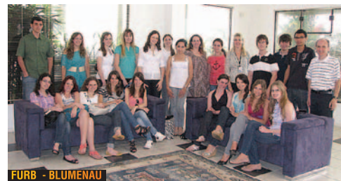
FURB - BLUMENAU