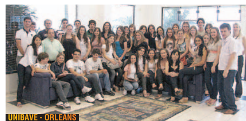
UNIBAVE - ORLEANS