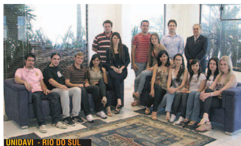
UNIDAVI - RIO DO SUL